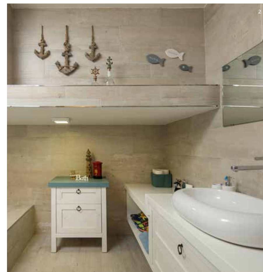
1. חדרי השינה של הילדים המתבגרים עוצבו גם הם כסוויטות מפנקות עם חדרי רחצה צמודים ושילובים של מראה קלאסי וצעיר. 2. חדר הרחצה המפנק הסמוך לסוויטת ההורים עוצב באווירה אינטימית וקלאסית.