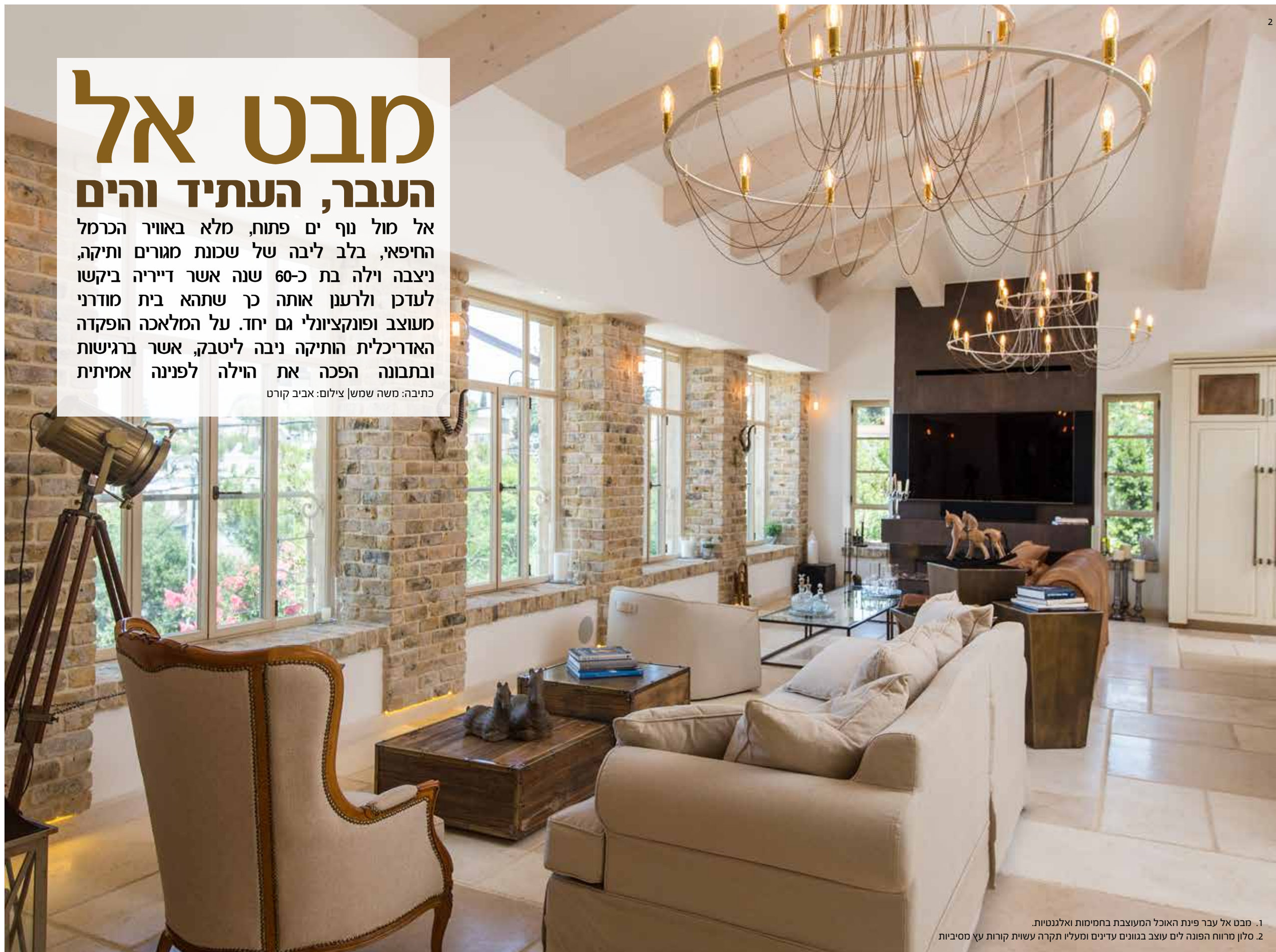
1. מבט אל עבר פינת האוכל המעוצבת בחמימות ואלגנטיות. 2. סלון מרווח הפונה לים עוצב בגווני עדינים ומעליו תקרה עשוית קורות עץ מסיביות

כיצד משפצים ומחדשים וילה ותיקה שנבנתה לפני כ-60 שנה מבלי לפגוע באופיה האותנטי? זהו אחד מן האתגרים המרכזיים שעמד בפני האדריכלית הותיקה ניבה ליטבק. ליטבק, בוגרת הפקולטה לאדריכלות ובנין וערים בטכניון, עוסקת מזה כ-30 שנה בתחום, כאשר בעשור האחרון מתמקדת בעבודתה בוילות ודירות יוקרה כדוגמת פרויקט זה.