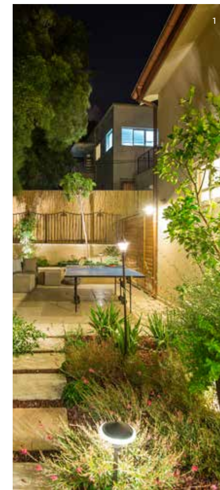
1. חזיתות הבית הולבשו באבן פירוקים גסה ובתוספת בריקים מחימר המעניקים לו מראה כפרי וחמים כבר מבחוץ. 2. מבט על הגינה המטופחת במראה הלילי עם תאורות ממוקדות והרבה צמחייה. 3. הכניסה לבית מלווה בדלת עץ כבירה ואלגנטית המרסדת על תוכו. 4. מבט על גינת האירוח ובה פרגולה הצופה לנוף ומיטות שיזוף מפנקות. 5. פינת אוכל חיצונית לארוחות משפחתיות ולאירוח בימים שטופי שמש.