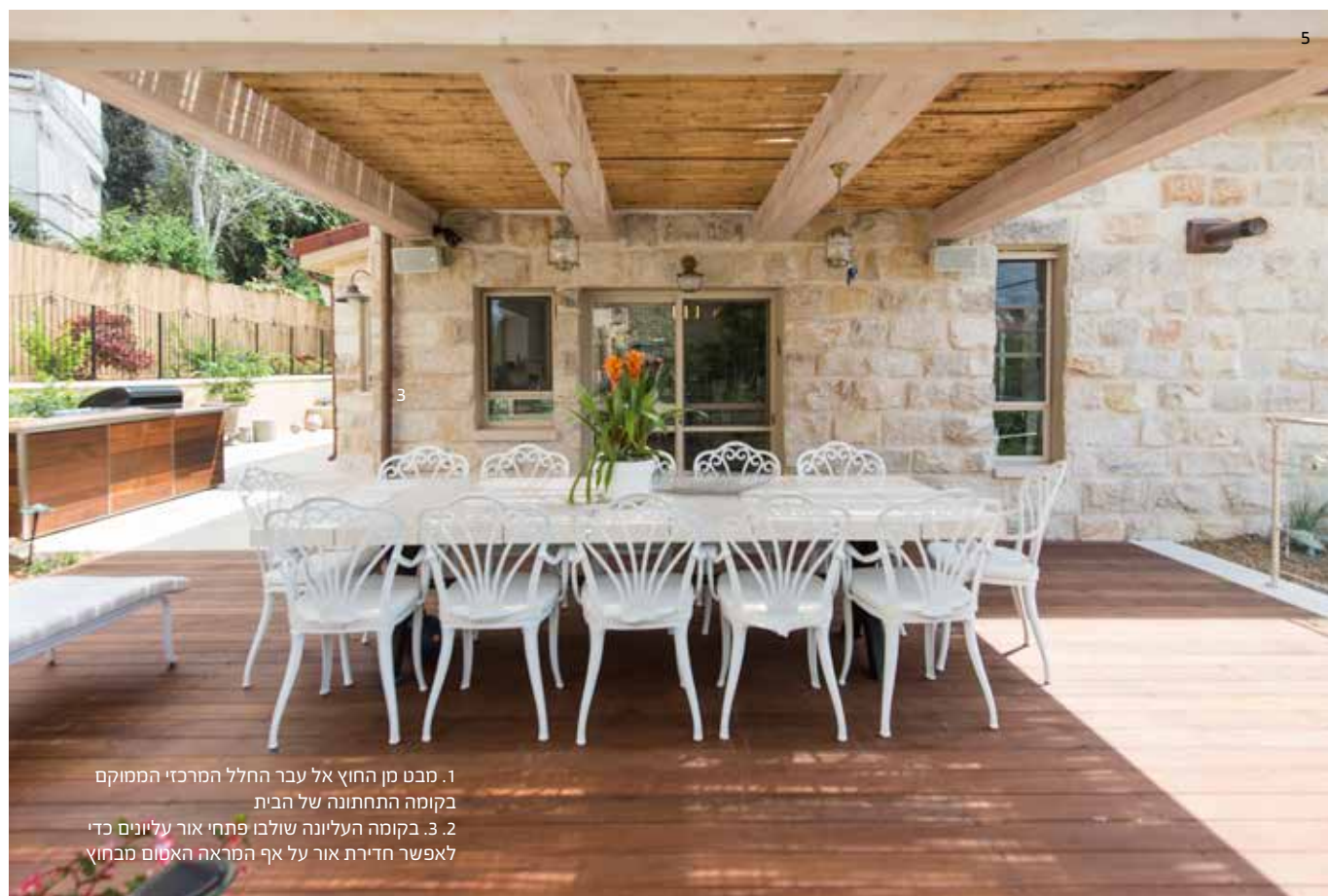
1. מבט מן החוץ אל עבר החלל המרכזי הממוקם בקומה התחתונה של הבית 2. בקומה העליונה שולבו פתחי אור עליונים כדי לאפשר חדירת אור על אף המראה האטום מבחוץ